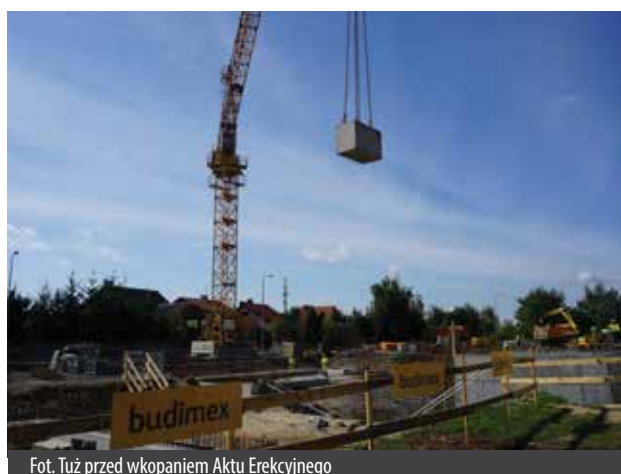
Fot. Tuż przed wkopaniem Aktu Erekcyjnego

Budowa Centrum Kształcenia Praktycznego pochłonięć ma około 34 mln zł, z czego blisko 20 mln zł pochodzi z funduszy unijnych, które udało się pozyskać Starostwu Powiatowemu w Poznaniu finansującemu inwestycję. Nowa placówka oświatowa charakteryzować się ma europejskim poziomem kształcenia i wyposażenia. Do istniejącego budynku Zespołu Szkół nr 1 im. Powstańców Wielkopolskich w Swarzędzu, dobudowany ma być nowy budynek na planie litery „L”, dwu i trzykondygnacyjny, częściowo podpiwniczony, z 18 specjalistycznymi pracowniami i częścią hotelowo-gastronomiczną. Obiekt ma być przyjazny dla osób niepełnosprawnych. Powstanie też wolnostojąca stacja diagnostyczna dla samochodów z dwustanowiskowym garażem.