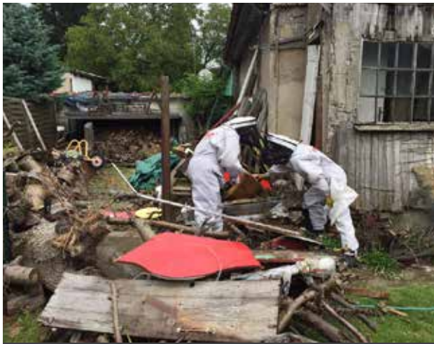
Fot. Podczas usuwania gniazd owadów obowiązuje zachowanie szczególnej ostrożności

U większości ludzi pojedyncze użądlenie przez owada nie wymaga pomocy medycznej. Jeśli jednak osoba zostanie użądlnona we wrażliwe miejsce, takie jak np. okolice oczu – aby zmniejszyć objawy należy podać jej aspirynę lub ibuprofen. Miejscowo pomogą również zimne okłady. Zaś w przypadku użądlenia w jamie ustnej czy gardłowej trzeba niezwłocznie przewieźć osobę do szpitala. Gdyby użądleń było wiele, może wówczas dojść do silnej reakcji alergicznej czy nawet do niebezpiecznego wstrząsu anafilaktycznego.