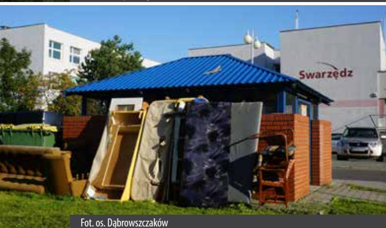
Fot. os. Dąbrowszczaków