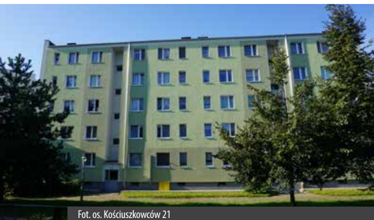
Fot. os. Kościuszkowców 21