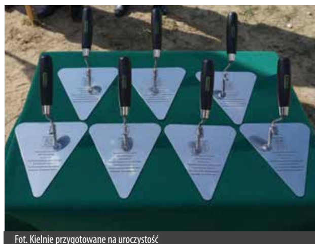
Fot. Kielnie przygotowane na uroczystość