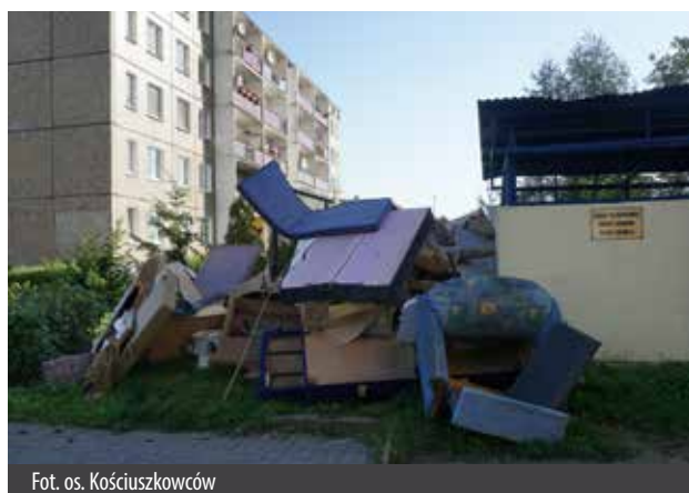
Fot. os. Kościuszkowców