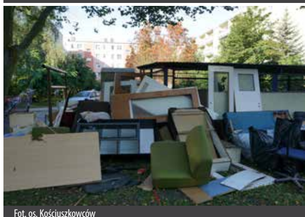
Fot. os. Kościuszkowców