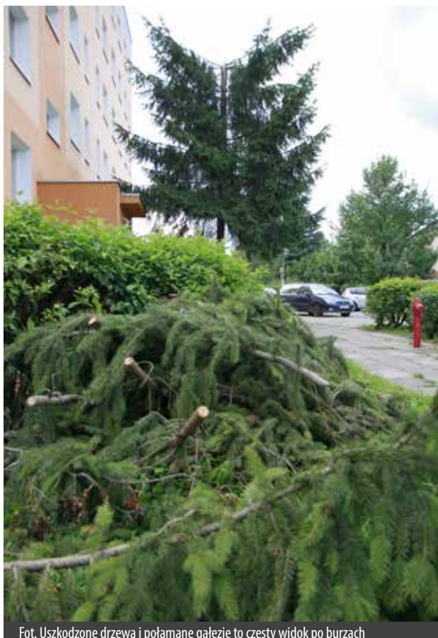
Fot. Uszkodzone drzewa i połamane gałęzie to częsty widok po burzach

W przypadku zauważenia uszkodzeń spowodowanych przez warunki pogodowe, OSP prosi o zgłoszenia pod nr telefonu 998.