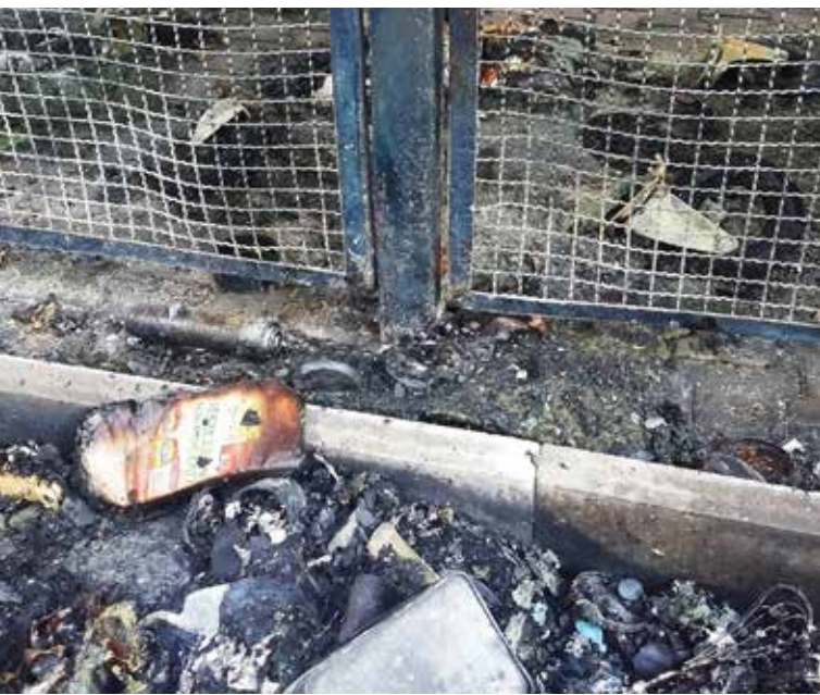
Fot. Piotr Szaroleta