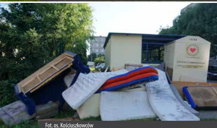
Fot. os. Kościuszkowców