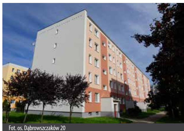
Fot. os. Dąbrowszczaków 20