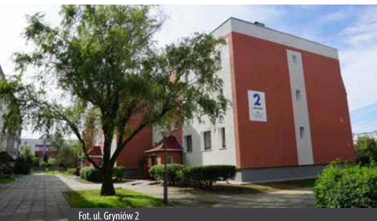
Fot. ul. Gryniów 2