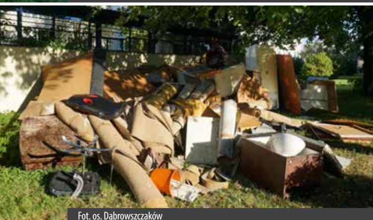
Fot. os. Dąbrowszczaków