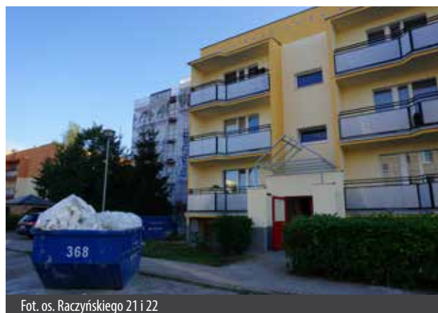
Fot. os. Raczyńskiego 21 i 22