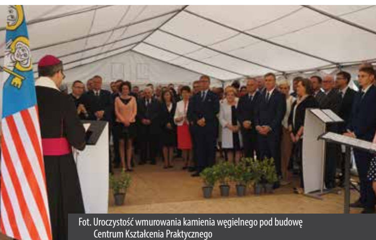
Fot. Uroczystość wmurowania kamienia węgielnego pod budowę Centrum Kształcenia Praktycznego