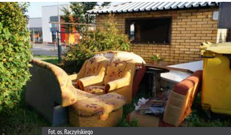
Fot. os. Raczyńskiego