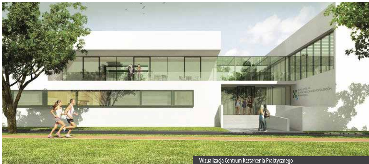
Wizualizacja Centrum Kształcenia Praktycznego

W poniedziałek, 18 września 2017 r., w Swarzędzu na os. Mielżyńskiego wbudowano kamień węgielny pod budowę Centrum Kształcenia Praktycznego.