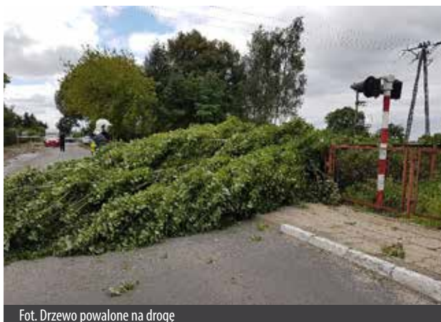
Fot. Drzewo powalone na drogę

Podczas miesięcy wakacyjnych nawałnice atakowały nas niejednokrotnie. Były bardzo intensywne, pojawiały się z zaskoczenia. Wichury im towarzyszące były przyczyną powalania drzew, m.in. na drogi, chodniki, ścieżki (co często było związane z utrudnieniem przejścia czy przejazdu), uszkodzeń budynków i płotów, zerwania linii energetycznych i telekomunikacyjnych, czy przerw w dostawach prądu. Opady deszczu skutkowały zalewaniem posesji i ulic. Zmniejszały także widoczność i przyczepność na drogach, a więc utrudniały warunki jazdy. Choć swarzędzcy Strażacy nie odnotowali uszkodzeń bezpośrednich przez pioruny, należy mieć świadomość, że mogą one powodować pożary lub być przyczyną utraty zdrowia czy życia.