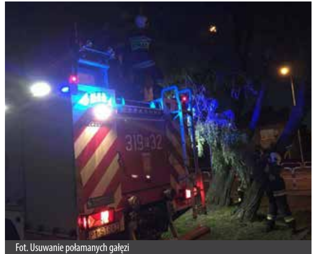
Fot. Usuwanie połamanych gałęzi