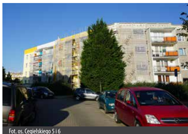
Fot. os. Cegielskiego 5 i 6