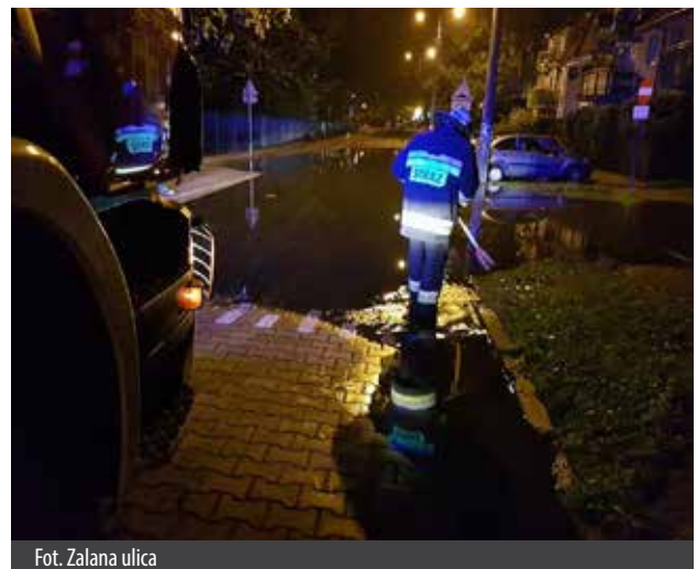
Fot. Zalana ulica