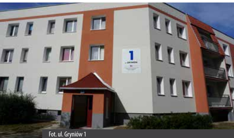
Fot. ul. Gryniów 1