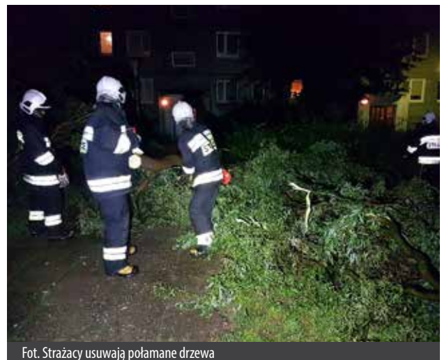
Fot. Strażacy usuwają połamane drzewa