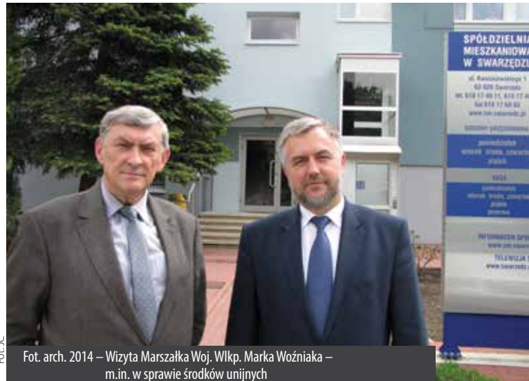
Fot. JC Fot. arch. 2014 – Wizyta Marszałka Woj. Wlkp. Marka Woźniaka – m.in. w sprawie środków unijnych