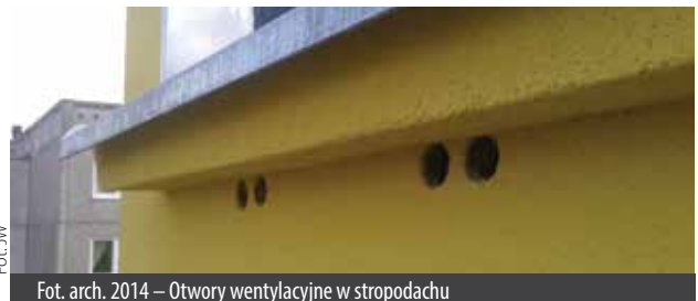
Fot. arch. 2014 – Otwory wentylacyjne w stropodachu