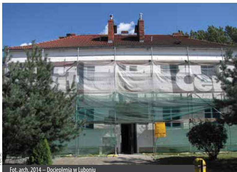
Fot. JC Fot. arch. 2014 – Docieplenia w Luboniu