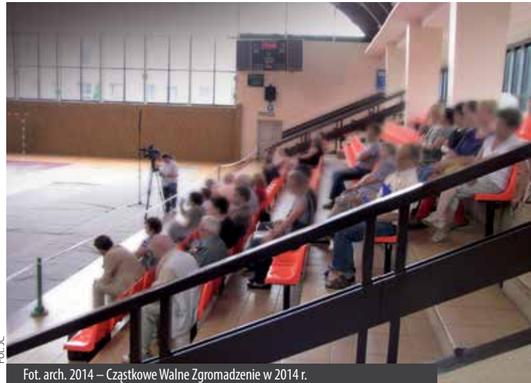
2014 – Częstkowe Walne Zgromadzenie w 2014 r.

Niniejszy Regulamin obowiązuje do czasu zatwierdzenia nowego statutu Spółdzielni.