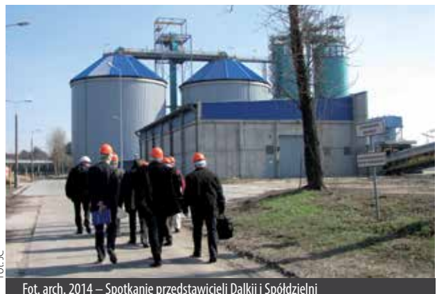
Fot. arch. 2014 – Hala Dalkii