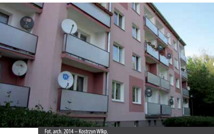
2014 – Kostrzyn Wlkp.