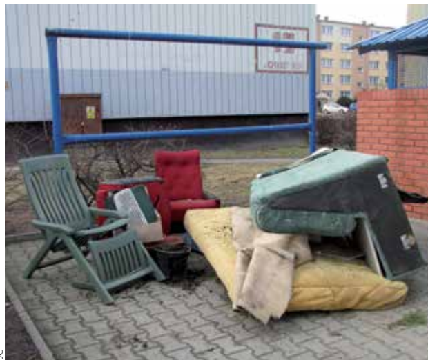
2014 – Rozmowy z GOAP