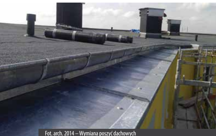
Fot. arch. 2014 – Wymiana poszyc dachowych