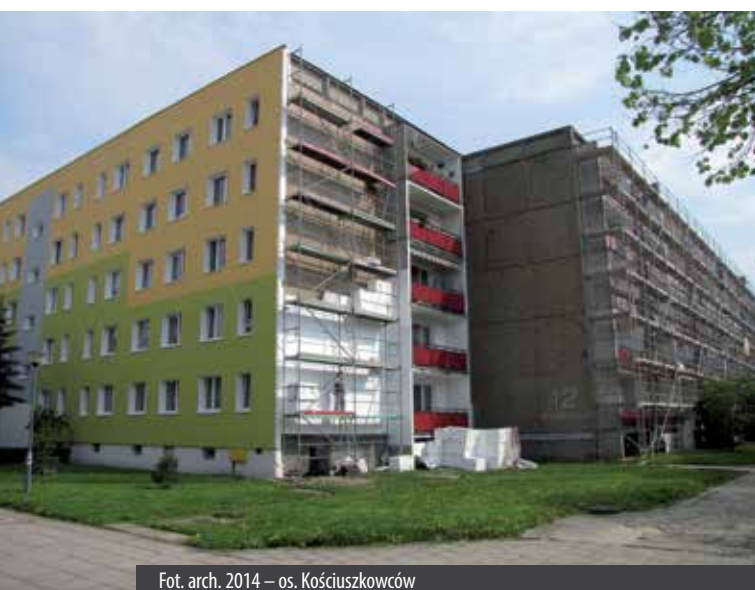
2014 – os. Kościuszkowców