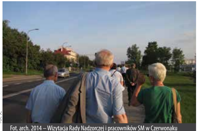
Fot. arch. 2014 – Wizytacja Rady Nadzorczej i pracowników SM w Antoninku