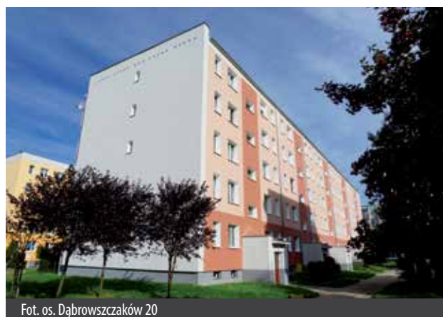
Fot. os. Dąbrowszczaków 20