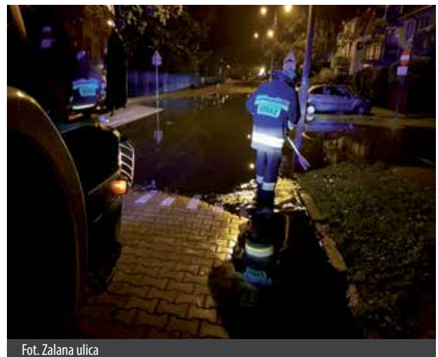
Fot. Zalana ulica