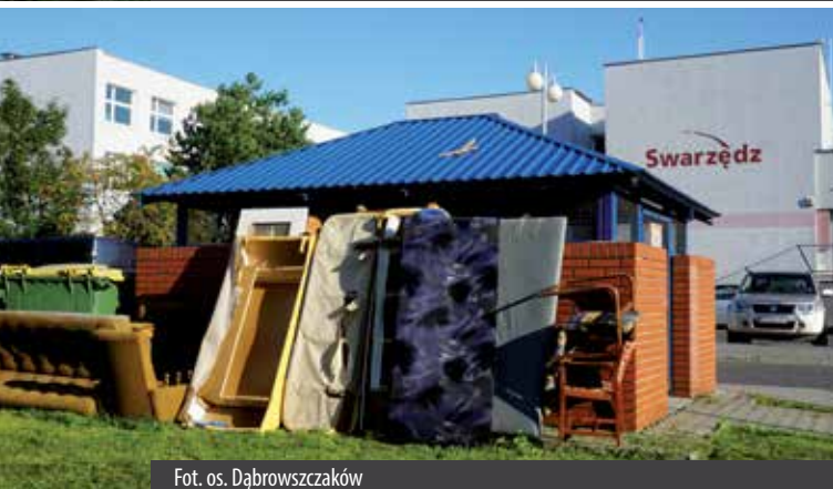
Fot. os. Dąbrowszczaków