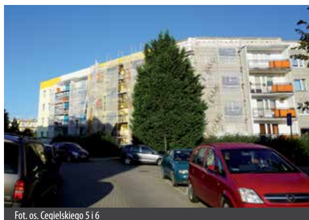
Fot. os. Cegielskiego 5 i 6