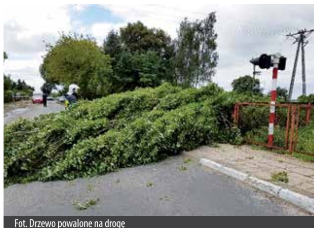
Fot. Drzewo powalone na drogę

Podczas miesięcy wakacyjnych nawałnice atakowały nas niejednokrotnie. Były bardzo intensywne, pojawiały się z zaskoczenia. Wichury im towarzyszące były przyczyną powalania drzew, m.in. na drogi, chodniki, ścieżki (co często było związane z utrudnieniem przejścia czy przejazdu), uszkodzeń budynków i płotów, zerwania linii energetycznych i telekomunikacyjnych, czy przerw w dostawach prądu. Opady deszczu skutkowały zalewaniem posesji i ulic. Zmniejszały także widoczność i przyczepność na drogach, a więc utrudniały warunki jazdy. Choć swarzędzcy Strażacy nie odnotowali uszkodzeń bezpośrednich przez pioruny, należy mieć świadomość, że mogą one powodować pożary lub być przyczyną utraty zdrowia czy życia.