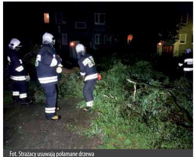
Fot. Strażacy usuwają połamane drzewa