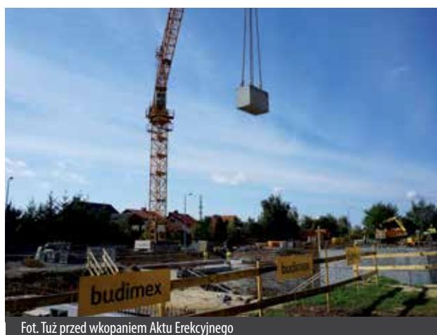
Fot. Tuż przed wkopaniem Aktu Erekcyjnego

Budowa Centrum Kształcenia Praktycznego pochłonieć ma około 34 mln zł, z czego blisko 20 mln zł pochodzi z funduszy unijnych, które udało się pozyskać Starostwu Powiatowemu w Poznaniu finansującemu inwestycję. Nowa placówka oświatowa charakteryzować się ma europejskim poziomem kształcenia i wyposażenia. Do istniejącego budynku Zespołu Szkół nr 1 im. Powstańców Wielkopolskich w Swarzędzu, dobudowany ma być nowy budynek na planie litery „L”, dwu i trzykondygnacyjny, częściowo podpiwniczony, z 18 specjalistycznymi pracowniami i częścią hotelowo-gastronomiczną. Obiekt ma być przyjazny dla osób niepełnosprawnych. Powstanie też wolnostojąca stacja diagnostyczna dla samochodów z dwustanowiskowym garażem.