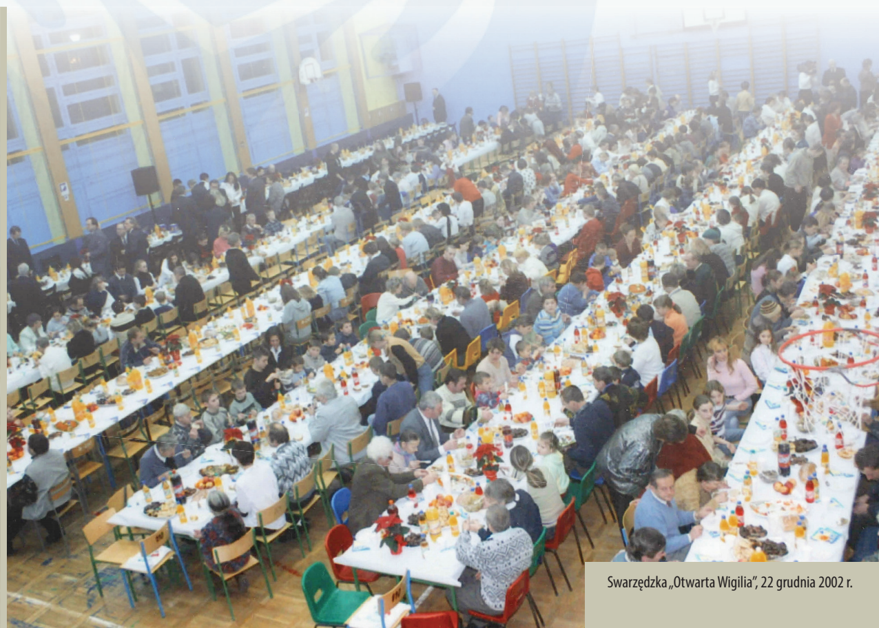
Swarzędzka „Otwarta Wigilia”, 22 grudnia 2002 r.

Odzież, artykuły gospodarstwa domowego i wszelkiego rodzaju inne przydatne przedmioty są obecnie darami od mieszkańców naszego miasta. Oprócz ubrań, przekazują oni zarówno mniejsze rzeczy, takie jak książki, zabawki, buty, talerze, jak i te o większych gabarytach – np. lodówki czy pralki. Mieszkańcy mogą przynosić rzeczy do magazynu we wtorki i środy od 16:30-19:00, a także w czwartki od 9:00-13:00.