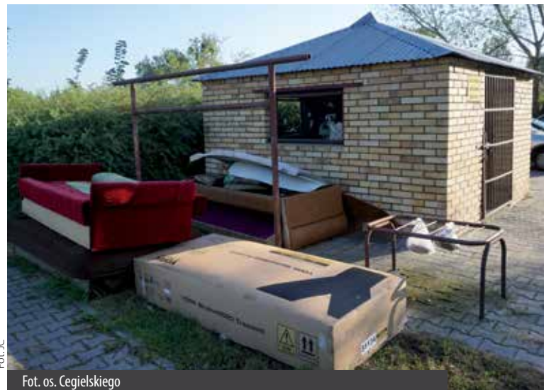
Fot. os. Cegielskiego

Najwidoczniejszą „wizytówką” działalności ZM GOAP od 4 lat są stopy odpadów wielkogabarytowych miesiącami leżące przy altanach śmietnikowych spółdzielni mieszkaniowych i wspólnot. Na co dzień tę właśnie „wizytówkę” obserwuje każdy mieszkaniec osiedli. Spółdzielnia podejmowała już wcześniej interwencje, zarówno w ZM GOAP,