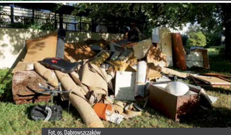
Fot. os. Dąbrowszczaków