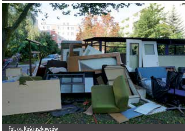
Fot. os. Kościuszkowców