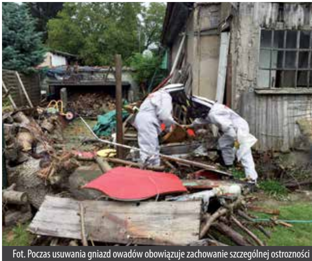
Fot. Podczas usuwania gniazd owadów obowiązuje zachowanie szczególnej ostrożności

U większości ludzi pojedyncze użądlenie przez owada nie wymaga pomocy medycznej. Jeśli jednak osoba zostanie użądlnona we wrażliwe miejsce, takie jak np. okolice oczu – aby zmniejszyć objawy należy podać jej aspirynę lub ibuprofen. Miejscowo pomogą również zimne okłady. Zaś w przypadku użądlenia w jamie ustnej czy gardłowej trzeba niezwłocznie przewieźć osobę do szpitala. Gdyby użądleń było wiele, może wówczas dojść do silnej reakcji alergicznej czy nawet do niebezpiecznego wstrząsu anafilaktycznego.