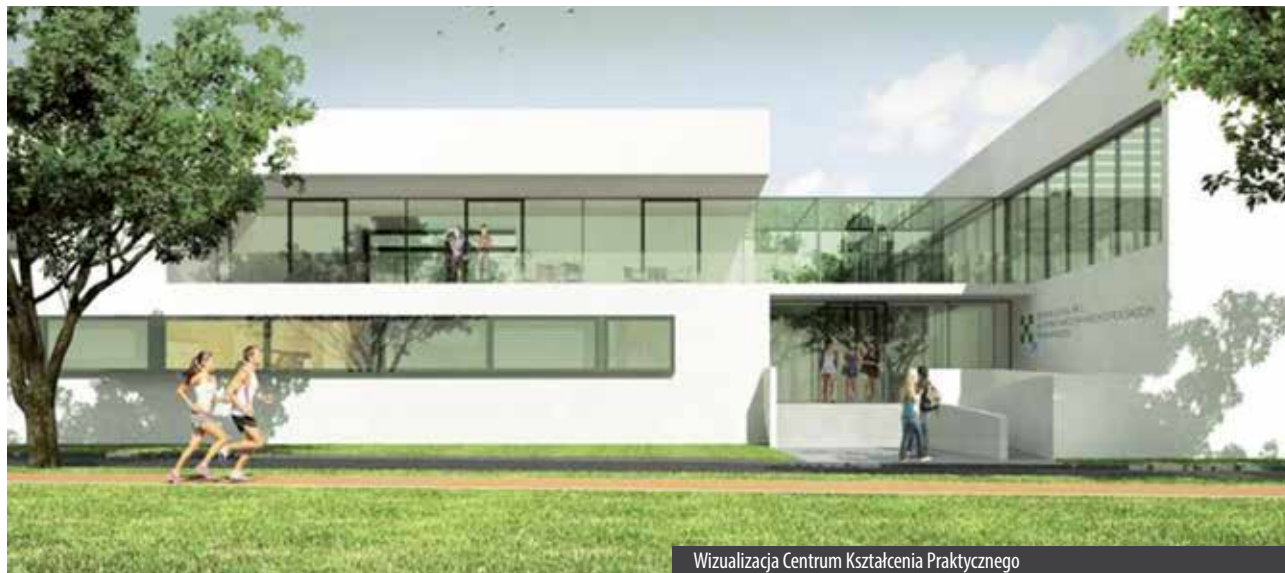
Wizualizacja Centrum Kształcenia Praktycznego

W poniedziałek, 18 września 2017 r., w Swarzędzu na os. Mielżyńskiego wbudowano kamień węgielny pod budowę Centrum Kształcenia Praktycznego.