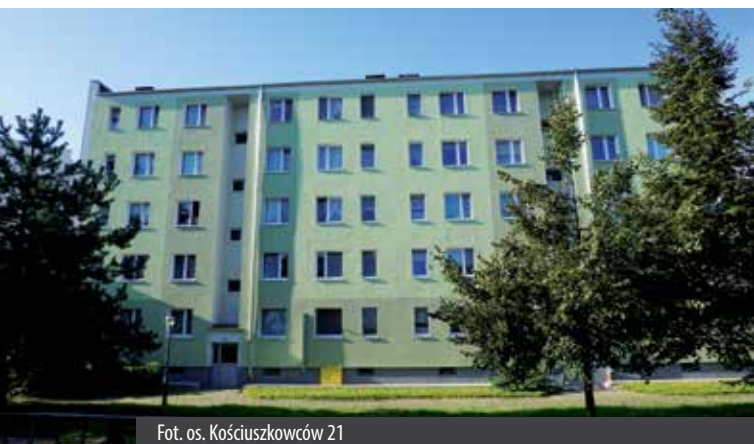
Fot. os. Kościuszkowców 21