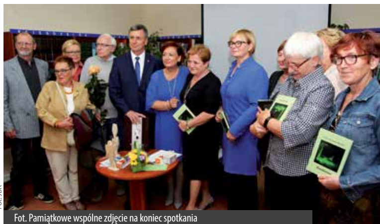
Fot. Pamiątkowe wspólne zdjęcie na koniec spotkania