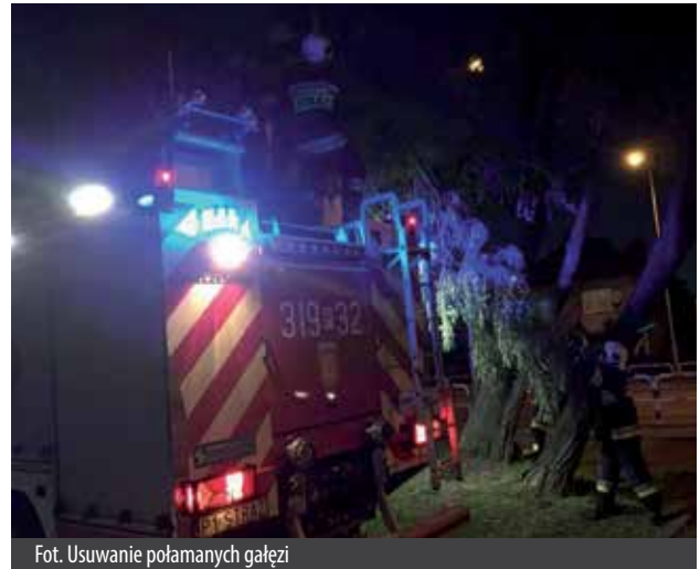
Fot. Usuwanie połamanych gałęzi