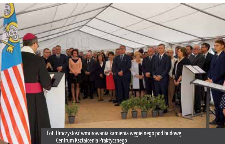
Fot. Uroczystość wmurowania kamienia węgielnego pod budowę Centrum Kształcenia Praktycznego