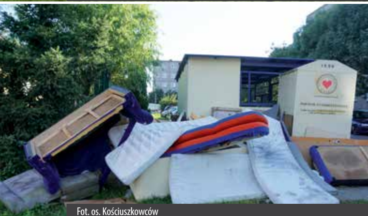
Fot. os. Kościuszkowców