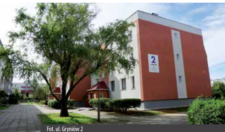
Fot. ul. Gryniów 2