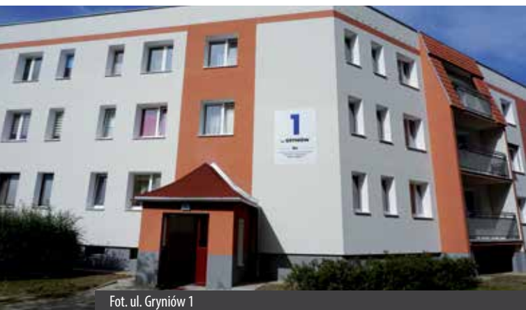
Fot. ul. Gryniów 1