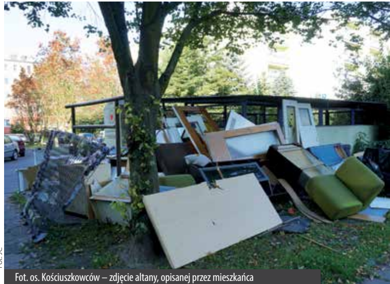
Fot. os. Kościuszkowców – zdjęcie altany, opisanej przez mieszkańca