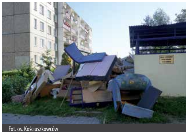
Fot. os. Kościuszkowców