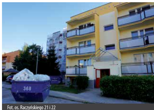
Fot. os. Raczyńskiego 21 i 22