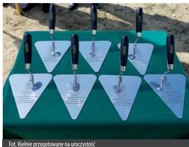
Fot. Kielnie przygotowane na uroczystość