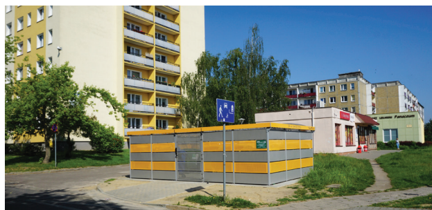
Altana na os. Kościuszkowców