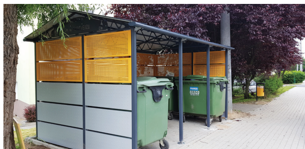
Mniejsza wiata w Czerwonaku