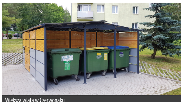
Większa wiata w Czerwonaku