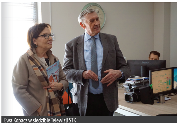
Ewa Kopacz w siedzibie Telewizji STK