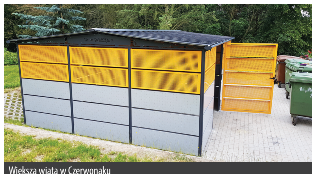
Większa wiata w Czerwonaku